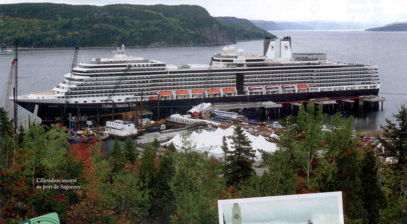
L' Eurodam amarré au port de Saguenay