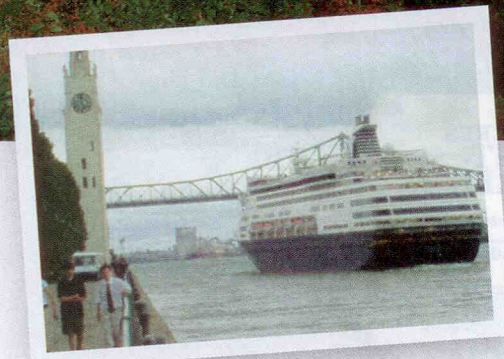
Le Maasdam au départ de Montréal

Au départ de Montréal ou de Québec en 2009, on dénombre une vingtaine de possibilités de faire du tourisme maritime à la fois au Québec, dans les provinces atlantiques et sur la côte Est des États-Unis. Soulignons que bon an, mal an, le Maasdam , un très beau navire de 55 500 tonnes d'une capacité de 1 266 passagers de Holland America Line, est fidèle au rendez-vous au port de Montréal pour une croisière de sept jours avec comme point d'arrivée final le port de Boston. C'est ce navire qui remporte cette année la palme de la croisière québécoise par excellence, avec quatre escales (Québec, Saguenay, Baie-Comeau et Gaspé) effectuées lors de son repositionnement vers la Floride en octobre 2009.