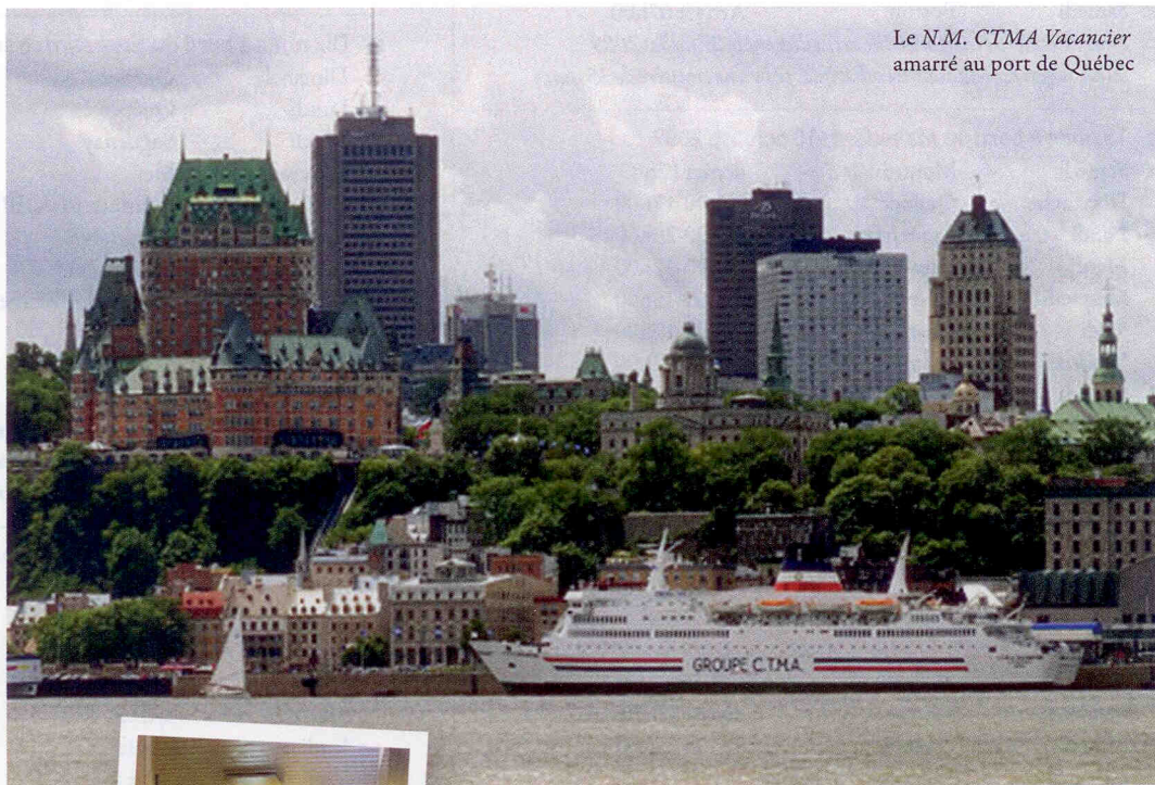
Le N.M. CTMA Vacancier amarré au port de Québec

Le N.M. CTMA Vacancier est un navire-traversier de 13 000 tonnes qui peut transporter jusqu'à 450 passagers et